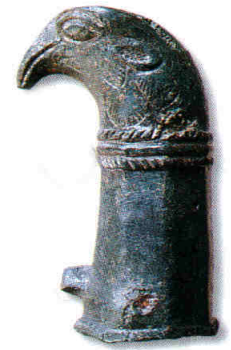
Adlerkopf-Aufsatz eines römischen Reisewagens (Länge 9,7 cm).